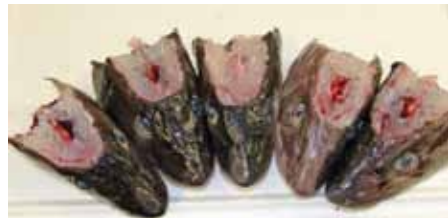
Massive blødninger i hjernen forteller om en hurtig død. Fisken i midten er såkalt «kontrollfisk» som ikke er avlivet med slag i hodet.

Det er ikke en del av dette prosjektet, men som ren bonus gir bruk av slag- og bløggemaskinen rask avlivning av fisken ved at den tilføres et slag i hodet samtidig med at den bløgges.