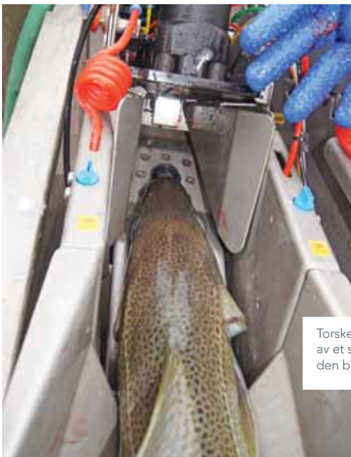
Torsken føres inn i maskinen og bedøves av et stempel fra oversiden samtidig som den bløgges fra undersiden.

Til de neste forsøkene om bord på M/K Bernt Oskar i 2012 ble det derfor foretatt justeringer av kniv, og laget nytt «inngangsparti» til maskinen tilpasset torskens hodefasong. I det neste forsøket så man at nye kniver og nytt inngangsparti ikke harmonerte og i det tredje og siste forsøket gikk man derfor tilbake til originalknivene, som man opplevde at maskinen traff presist på både stor og liten torsk.