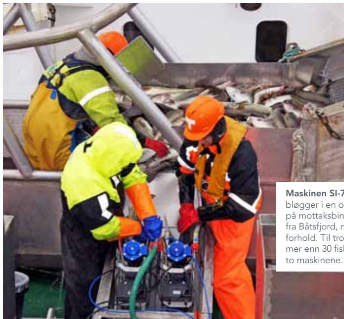
Maskinen SI-7 Combo som avliver og bløgger i en operasjon ble plassert direkte på mottaksbingen ombord på M/S Kildin fra Båtsfjord, noe som ga dårlige arbeidsforhold. Til tross for dette ble det bløgget mer enn 30 fisk per minutt, på hver av de to maskinene.

Det er slag- og bløggemaskinen SI-7 Combo til australske Seafood Innovations som nå utprøves i den norske havfiskeflåten. Maskinen som avliver og bløgger i en operasjon har i lang tid vært benyttet ved norske lakselakterier. Det spesielle ved disse maskinene er at de kan håndtere fisk fra to til åtte kilos størrelse, uten justering.