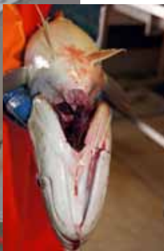
Her kontrolleres at bløggekutter kutter åren fra hjertet, den såkalte ettsnitts-metoden. Det konstateres at maskinen treffer presist over et stort størrelsesområde og dermed vil kunne tas i bruk i fangstbehandlingen ombord på snurrevadfartøy og trålere.'